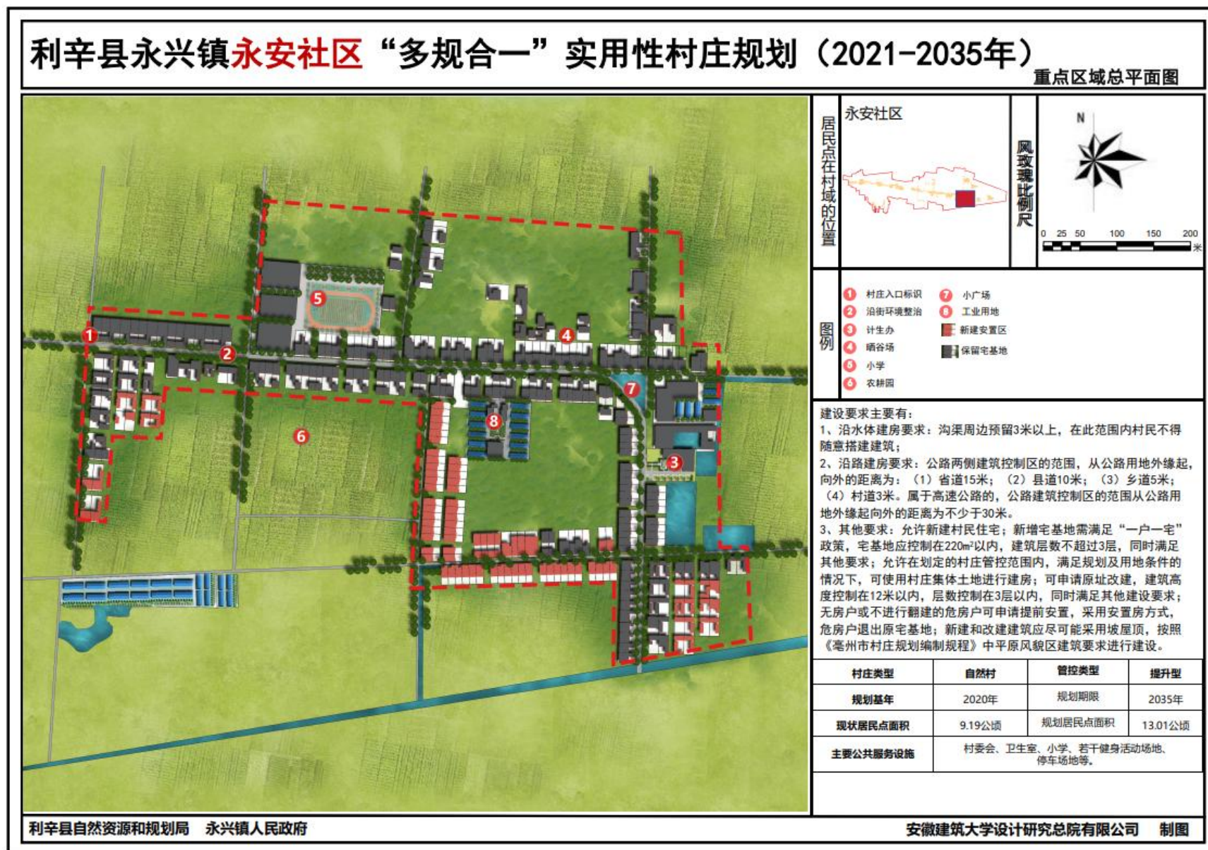
(2) 重点区域总平面图