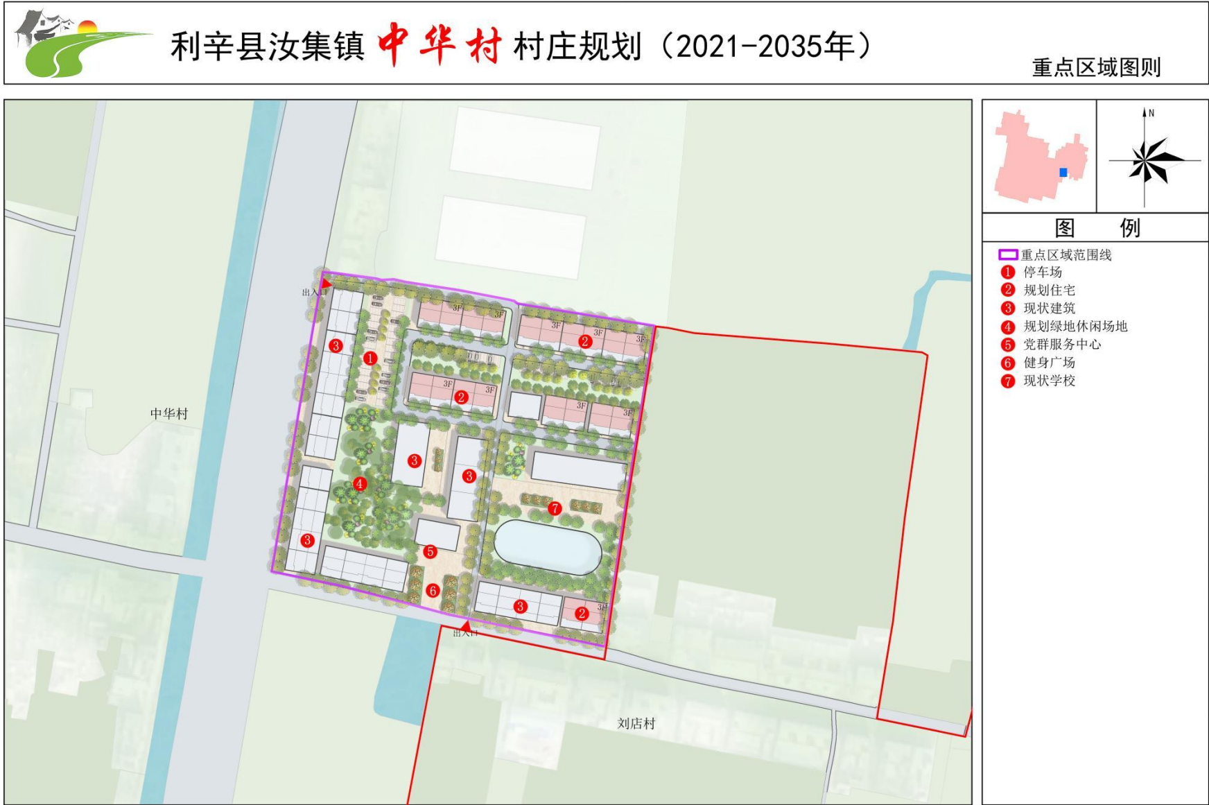
(2) 重点区域总平面图