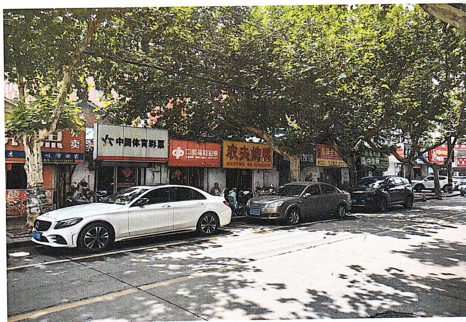
地块周边现场勘查照片