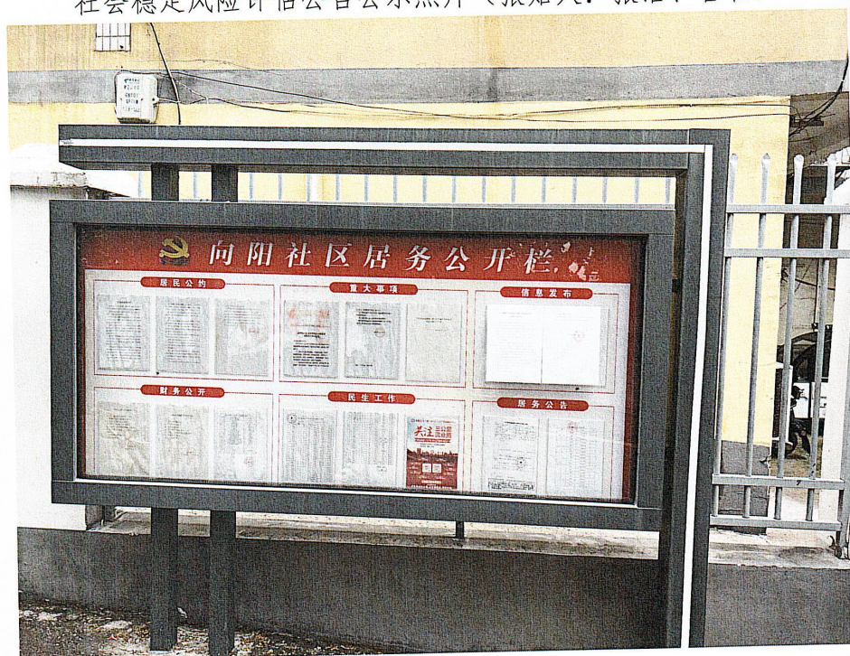
社会稳定风险评估公告公示照片（张贴人：张浩、管壮）